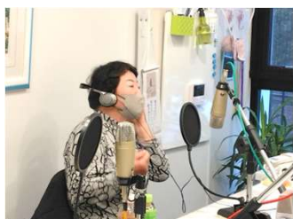
お話内容は人それぞれ社長の問いかけにすべてお答えいただくのみです