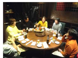
収録後は皆でちょっとリッチな晩御飯を食べて帰宅