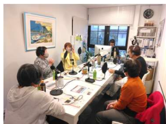
収録始まる前の雰囲気