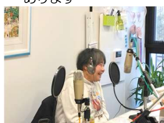
お1人ずつインタビュー