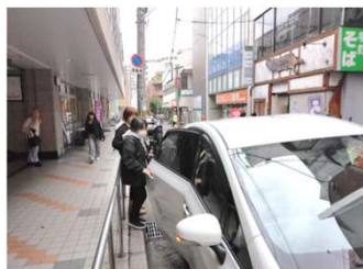
駅前などで待合せし、車でお迎えに行きます

社長がラジオ番組を始めて、過去90数名のスタッフさんが出演してくれました。では、ラジオの収録雰囲気ってどんなだろうと思うでしょ？今回はその雰囲気を待合せお迎えを含めて紹介しますね。