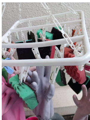
便器用の赤同士と洗面台用の緑同士を固めて分けていたらより良かったですね。