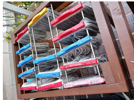
トイレ用の赤と廊下、フロア用の青とその他の色同志で分かれてたら、より良かったです。