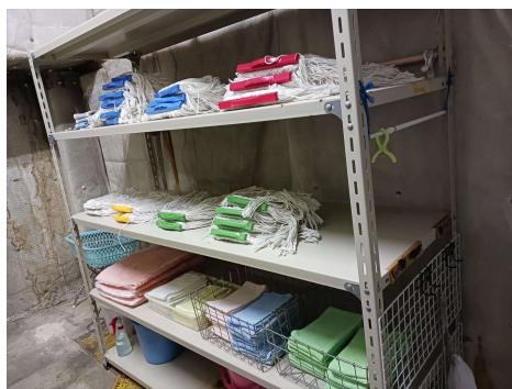
次はどの道具の置き場なのかの明記ですね 🍌

去る、2月26日に巡回訪問した各事業所点検での結果をご報告します。 今回は、できているんだけどあと少しとか、ひとひねりあればなどを紹介します。