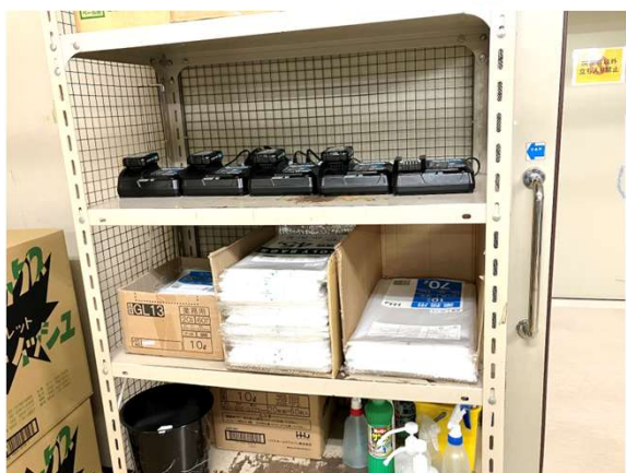
置場明記があれば、より良かったで すね💧