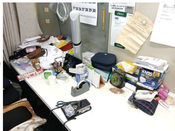
机の上に物が多すぎるので、必要な ものだけに見直しましょう！