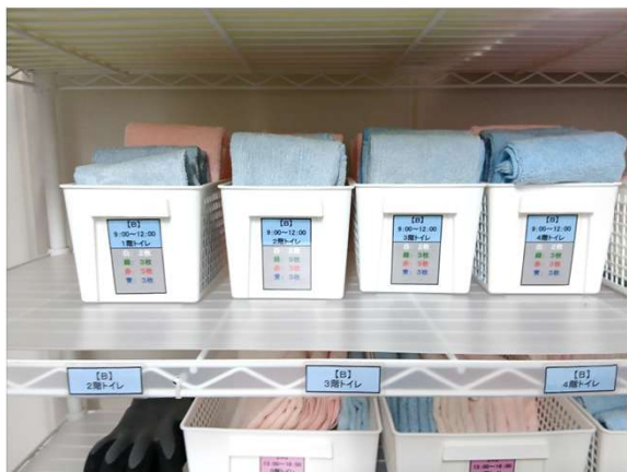
トイレコースで階ごとに明記され かつタオルの必要枚数まで明記さ れてるのは、エクセレント👍

去る、5月7日に巡回訪問した各事業所点検での結果をご報告します。 どこも、だいぶ出来上がってきてました👍