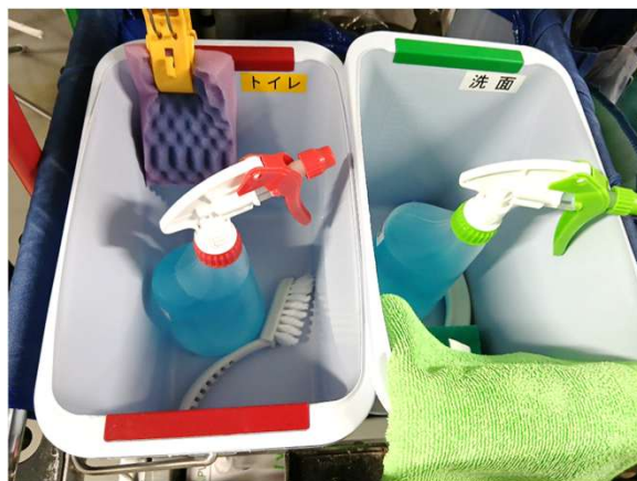
清汚の区別ができており流石です👍